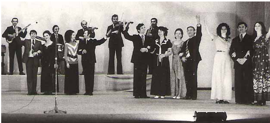
Spectacolul „Un revelion de...pomină”