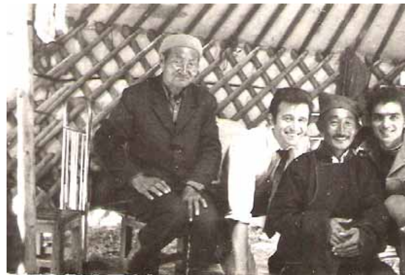
Aspect din turneul din Mongolia, Ulan-Bator

Anul 1974 este cel în care ansamblul primește invitația de a participa la un turneu protocolar în Mongolia, Coreea de Nord și China , în urma vizitelor lui Nicolae Ceaușescu în aceste țări. A fost primul zbor cu avionul al solistului, care a creat multe emoții. Aceasta din cauza prăbușirii unui avion cu o delegație românească la bord, în deșert, în care au murit toți pasagerii. Singurul supraviețuitor, Nicolae Nistor , un „mamut” în dirijarea destinelor culturale ale vremii la nivelul Consiliul Culturii și Educației Socialiste, respectiv Casa Centrala a Creației Populare (pentru că minister nu era pe vremea aceea, n.r.) , un om de treabă de felul lui, a avut norocul să piardă avionul. A fost o întâmplare pe care a povestit-o ani de-a rândul tuturor, în toate peregrinările sale din țară. Referitor la acesta, cunoștea întreaga mișcare artistică din România, în detaliu. Deplasarea a fost reușită participând ambii soți Moldovan.